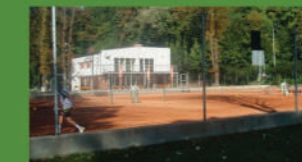
Kurtky a klubovna v areálu lázní.