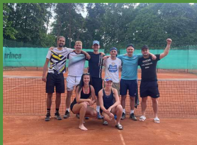
Tým dospělých po vítězném utkání v Olomouci