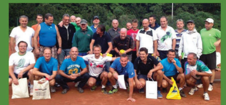
Turnaj mužů v roce 2013.