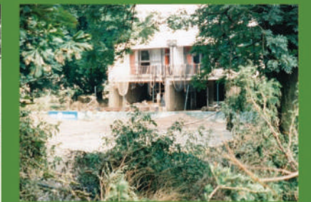
Následky povodně v roce 1997.