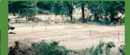
Následky povodně v roce 1997.