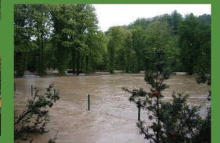
Povodeň v roce 2010.