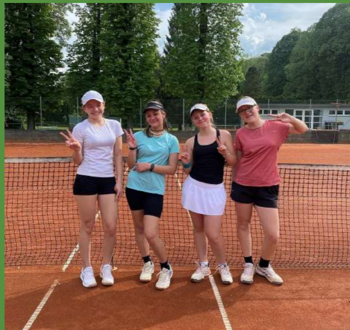
Starší žacky po vítězném utkání