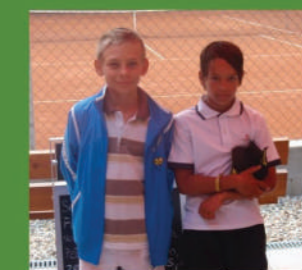
Snímek z tenisového turnaje mladších žáků v roce 2013.