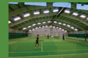
Tenisová hala v Žáčkově ulici.